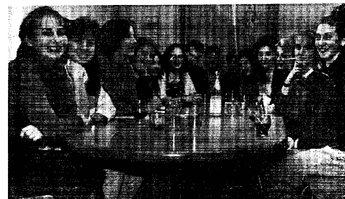
VIEL SPASS hatten die sechs polnischen Jugendlichen und ihre Hattinger Gastgeber. Sie verstanden sich prima — lediglich mit der Sprache gab es ein paar Probleme.

Lehrer Rinke hofft, daß das Projekt noch bekannter wird. Je größer die Teilnehmerzahl für die geplante Polen-Reise sei, umso besser. „Dann für viele deutsche Jugendliche ist Polen ein weißer Fleck auf der Landkarte. Wenn man nicht nur von Volkerverständigung reden will, dann muß es auf der untersten Ebene konkret werden.“ Und genau das versucht er.