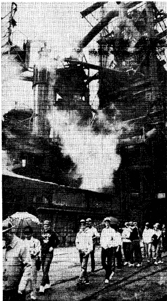
Besuch aus Amerika hatte gestern die Henrichshütte. Mit großem Interesse besichtigten 22 Austauschschüler und -schülerinnen die Hochöfen. Mehr über den Aufenthalt der jungen Amerikaner erfahren Sie auf Seite 3.