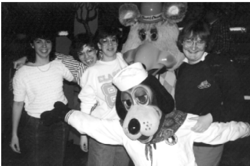
Gute Stimmung im „Pizza Palace“

Es war schön zu sehen, wie aller Fremdheit der Eindrücke zum Trotz von Tag zu Tag das Gefühl der Zusammengehörigkeit wuchs und der Gast bald fest in Familie und Freundeskreis integriert war. Dementsprechend begleitete den Abschied auf dem Flughafen lautes Schluchzen und wurde die Ankunft des Gegenbesuches leidenschaftlich bejubelt. Auch heute noch pflegen viele Ehemalige ihre herzliche Freundschaft und stehen telefonisch und brieflich miteinander in Kontakt.