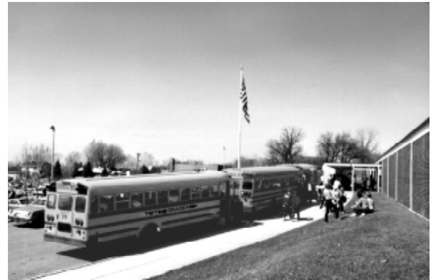
Die schuleigenen Busse sind abfahrbereit