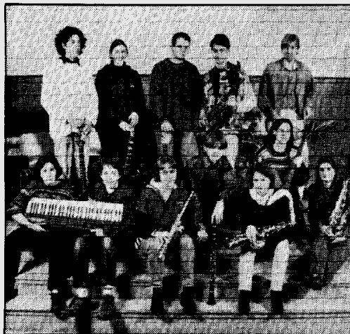
Jazzig geht es am Dienstag, 18. Februar, ab 19 Uhr beim „1. Internationalen Jazz-Abend 1997“ im Gymnasium an der Hattinger Waldstraße zu. Die „Lincoln Christ's Hospital School Band“, Schüler aus der englischen ROTA-Projekt-Partnerschule in Lincoln, wird gemeinsam mit der „Dow Jones and his Original Wall(l)d Street Jazz Gang“ (Foto) und der Big Band der Musikschule Lippstadt in der Schulaula zu hören sein. Bereits vor 2 Jahren hielt sich eine Musikgruppe aus Lincoln an der Hattinger Schule auf, im vergangenen Jahr reisten die „Waldsträfler“ nach England. Der Eintritt zum Jazz-Abend ist frei.