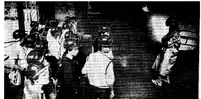
DIE FUNKEN SPRÜHTEN ganz gewaltig bei der Besichtigung der Stahlgewinnung in der Henrichshütte. Die amerikanischen Gäste staunten nicht schlecht.