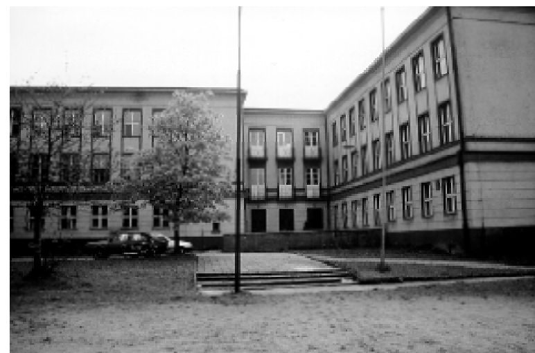
Rückansicht der Schule