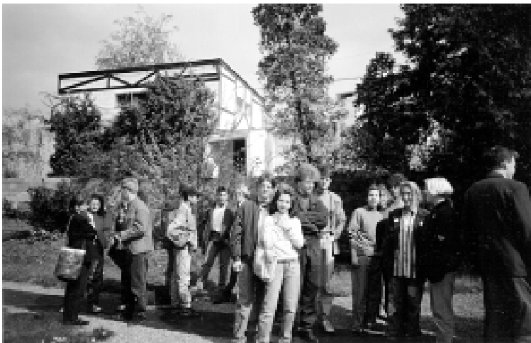
Visé / Frühling 1991: Deutsch-belgische Partnersuche auf dem Schulgelände